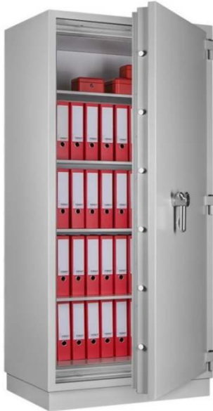
Articolo: PAPER STAR PLUS 5

Certificazione ignifuga: EN 1047-1 – 120 Minuti carta Certificazione allo scasso: ECB.S EN 1143-1 Grado I