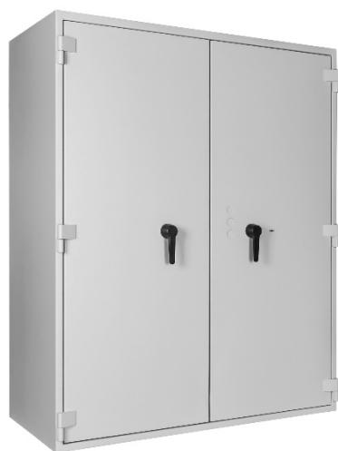
Paper Star Light 70Z