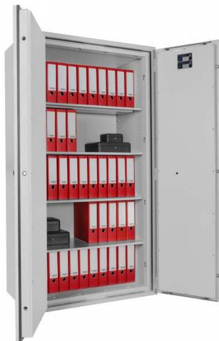
Paper Star Light 80 Z

Certificazione ignifuga: ECB.S EN 15659 LFS30P – 30 minuti carta