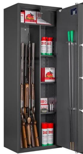
Art. WF 145 KOMBI

Certificazione allo scasso : EN 14450 Grado S1