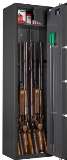
Art. WF 145-7