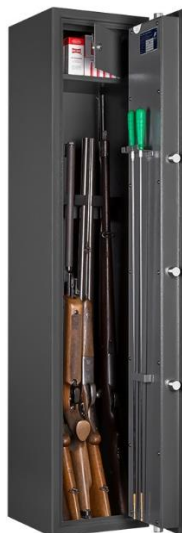
Art. WF 145-5