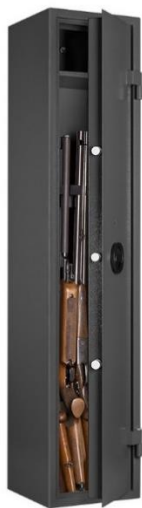
Art. WF 103