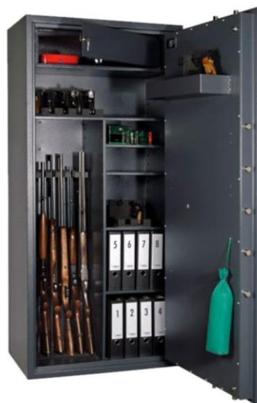
Art. CERVO V KOMBI

(N.B.: nella versione Multiset l'allestimento interno e' spedito smontato per permettere all'utilizzatore di comporlo in base alle sue esigenze)