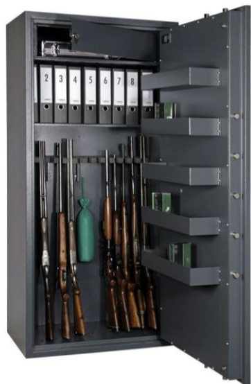
Art. CERVO V