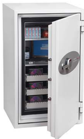
Articolo: DS4621 dotata di serratura elettronica