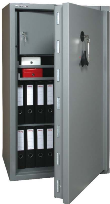
Articolo: CM 35 RK con tesoretto interno e ripiani estraibili

Dimensioni speciali, colore RAL a scelta, cerniere a sinistra e diversi tipi di serrature su richiesta. NOTE: Nella profondità è inclusa l'ingombro della maniglia.