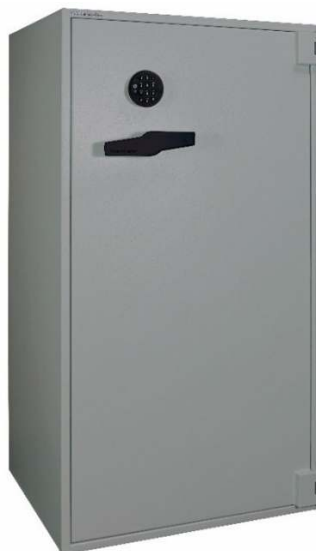
Articolo: BWS 1500 R con serratura elettronica

Certificazione allo scasso : ECB.S EN 1143-1 Grado II