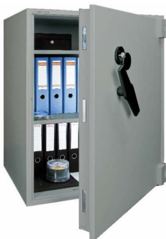
Articolo: BWS 1000 RK