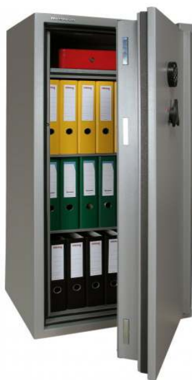
Articolo: BP 35 R con serratura elettronica

Certificazione allo scasso : ECBS EN 1143-1 Grado II