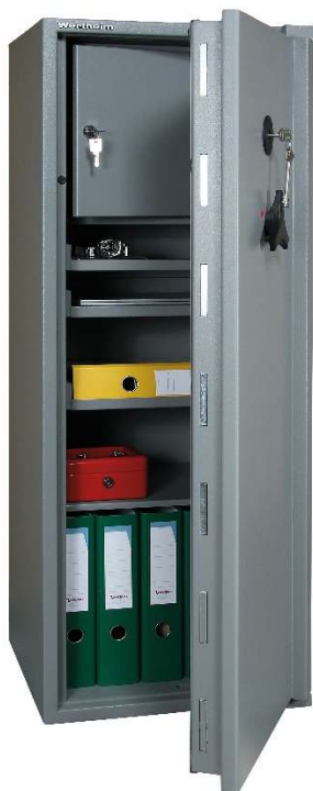
Articolo: BG35RK con chiusura a chiave, 3 vassoi estraibili e tesoretto H.340 mm

Certificazione allo scasso : ECB.S EN 1143-1 Grado II