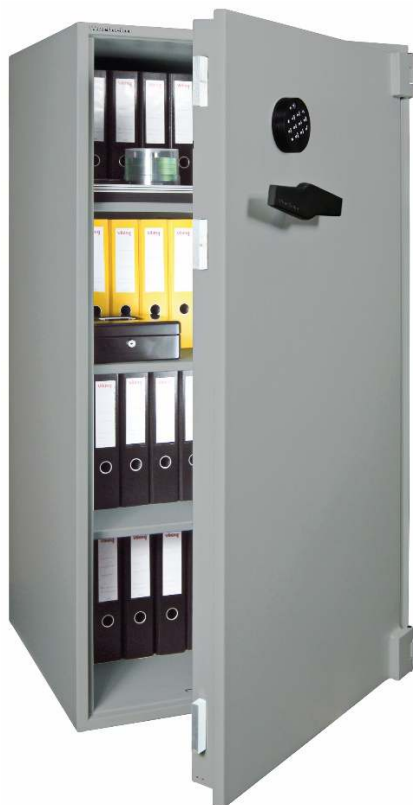
Articolo: AWS 1500RE

Certificazione allo scasso : ECB.S EN 1143-1 Grado I