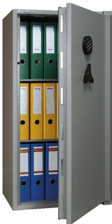
Articolo: AM30RK con chiusura elettronica

Dimensioni speciali, colore RAL a scelta, cerniere a sinistra e diversi tipi di serrature su richiesta. NOTE: Nella profondità è inclusa l'ingombro della maniglia.