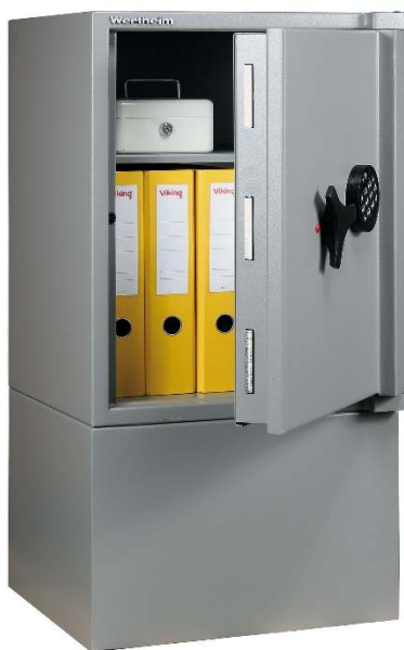
Articolo: AG15R con serratura elettronica e pinto

Certificazione allo scasso : ECB'S EN 1143-1 Grado I