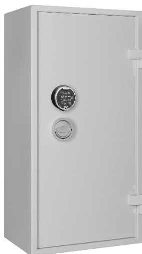
AS 1000 con serratura elettronica