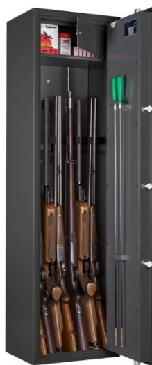
Art. WF 145-7