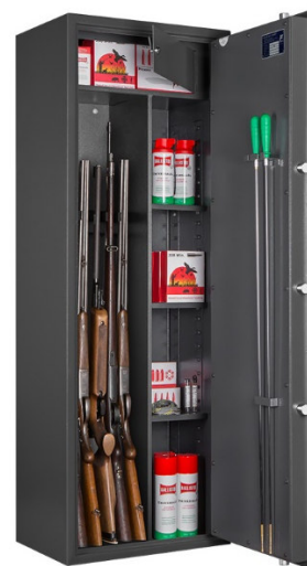
Art. WF 145 KOMBI