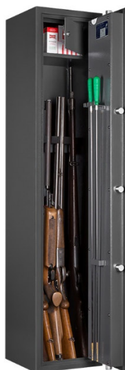
Art. WF 145-5