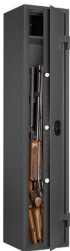
Art. WF 103