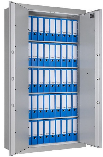
GTB 90 Z