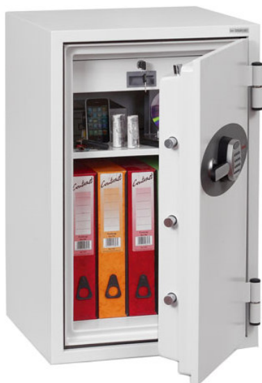
Articolo: FS0442 con serratura elettronica