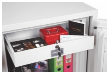
Cassetto con chiusura a chiave