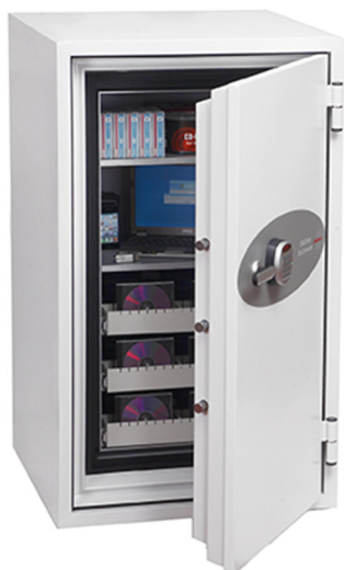
Articolo: DS4621 dotata di serratura elettronica