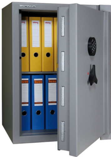
Articolo: CP 20 R con serratura elettronica

Certificazione allo scasso : ECB.S EN 1143-1 Grado III Certificazione ignifuga : EN 15659 LFS 30 P – 30 Minuti carta