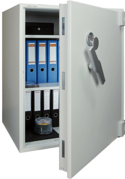
Articolo: BWS 1000 RK