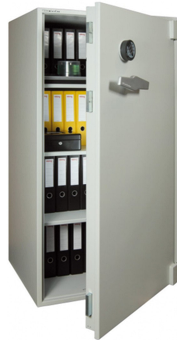
Articolo: BWS 1500 R con serratura elettronica

Certificazione allo scasso : ECB.S EN 1143-1 Grado II Certificazione atermica : DIN 4102