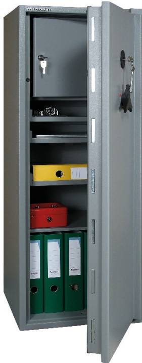
Articolo: BG35RK con chiusura a chiave e tesoretto H.340 mm

Certificazione allo scasso : ECB.S EN 1143-1 Grado II