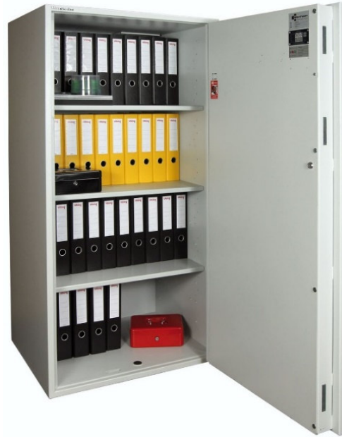
Articolo: AWS 1500R

Certificazione allo scasso : ECB.S EN 1143-1 Grado I Certificazione atermica : DIN 4102