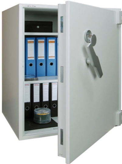
Articolo: AWS 1000RK